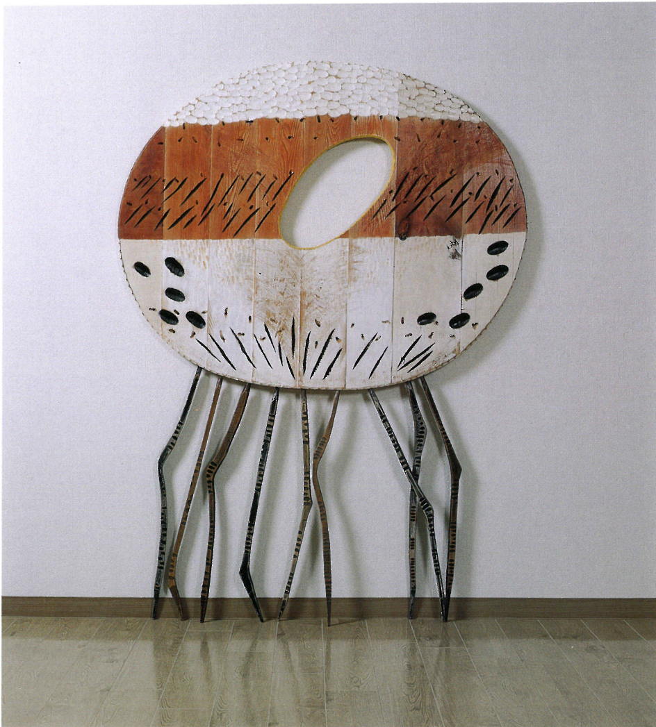
オヨメサン ニ アキゲシキ Bride in Autumn Scene