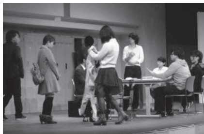
カガクするココロ