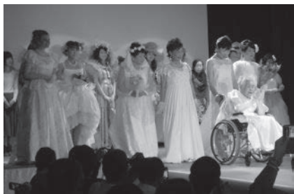
ミセスウェディングドレスプロジェクト 2015 今金コレクション