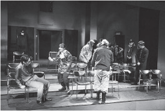
タンゴ・冬の終わりに

三月 ・三月九日(土)、一〇日(日) 劇団Birstage公演 Vol.8「ユ」同志(作: 坂手洋二、演出:森一生) 三