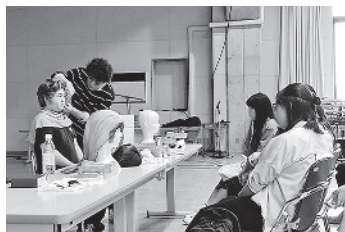
オープンキャンパス メイク講習

・七月八日(月) 五分間ストーリー「光る水晶」修正発表・公開授業 札幌円山キャンパス。