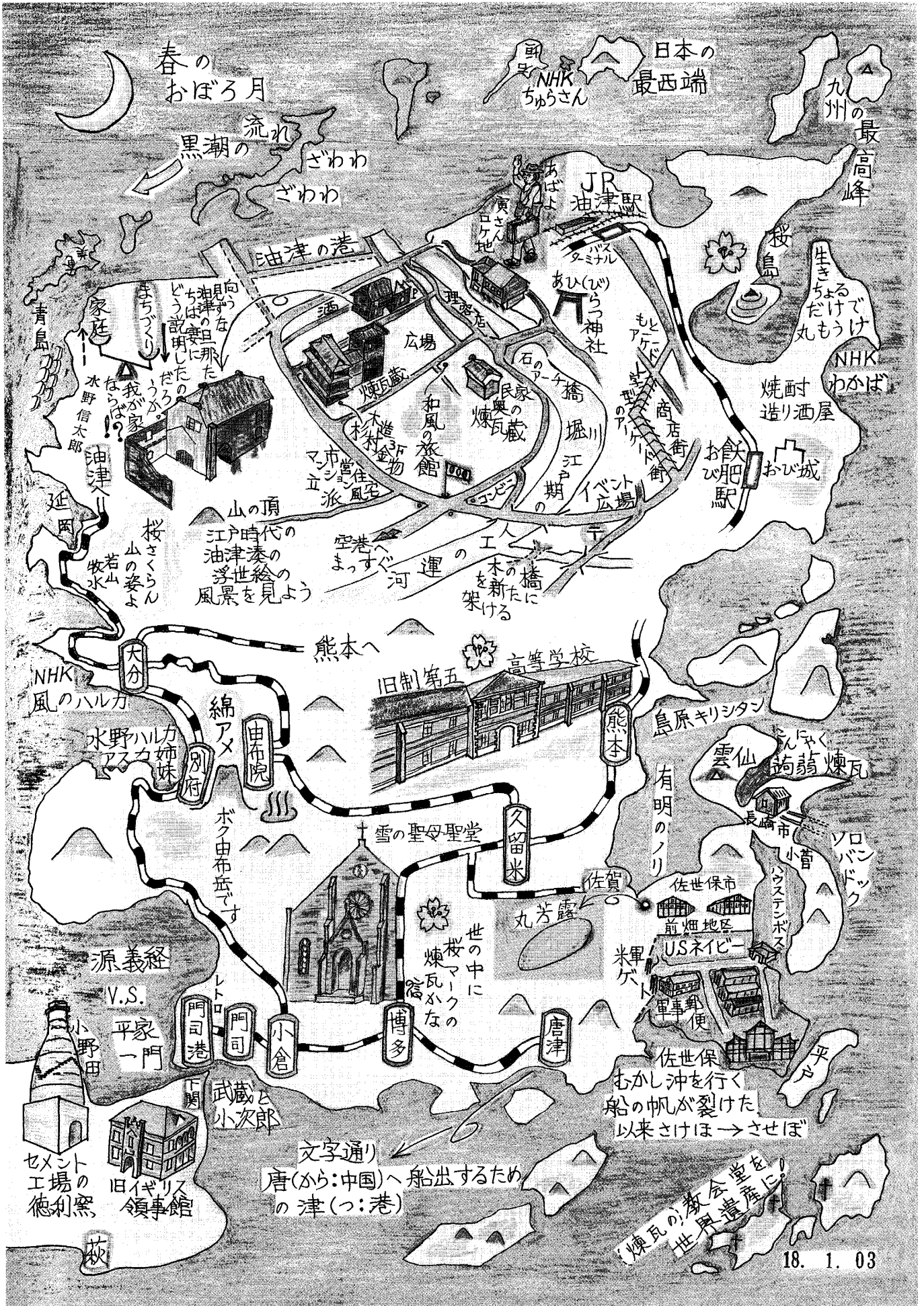
作品一 4 宮崎県日南市を中心とする鳥瞰図・春