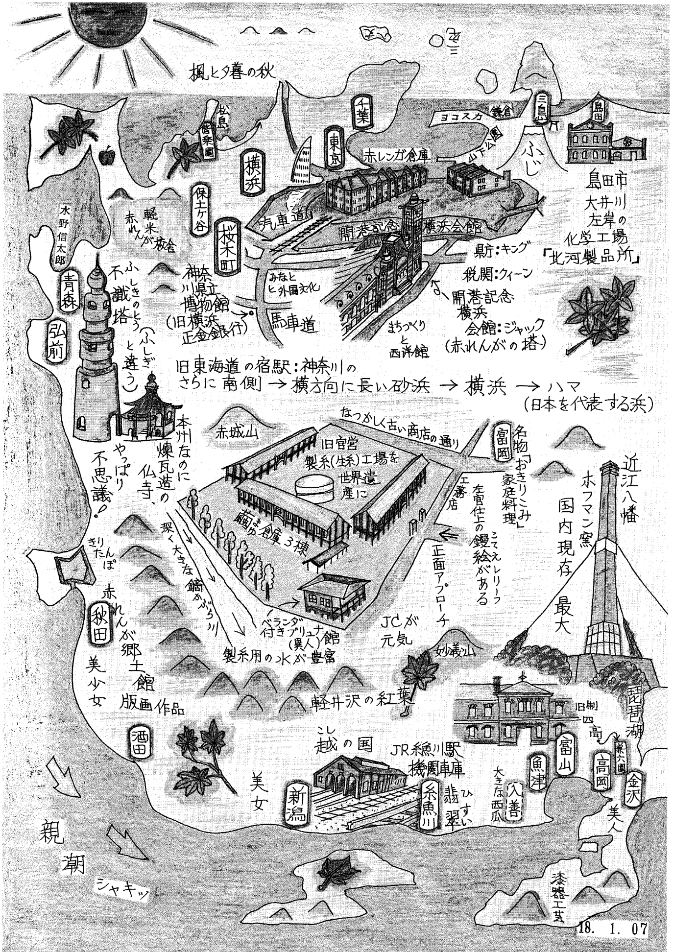
作品一 2 群馬県富岡市を中心とする鳥瞰図・秋